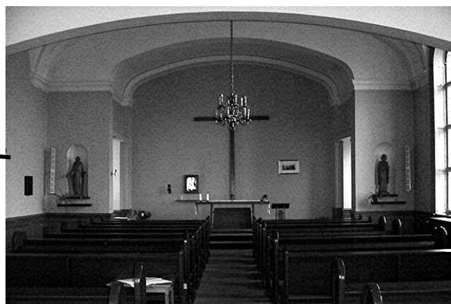
Kapellet i Institut Skt. Joseph.

Kapellet er 5 min.s gang fra Østerport station